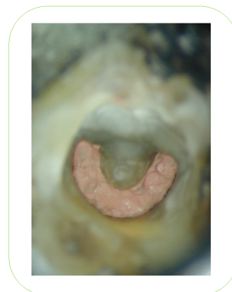
фото в микроскопе